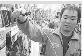
青物用から軟らかな穂先と粘りが売りのダイワ「クラブブルーオーシャン」海上釣り堀Ⅱ36ヘビータイプ

海上釣り堀用の竿と言っても、その調子、長さなどは本当に種類が多い。ウキ釣りでのマダイ狙いなら長さが36m前後で磯竿の3号調子、青物用ならもう少し太めで5号が一般的。そんな具合に、こだわってくると、奥深いのが釣り堀用の竿だ。また、メーカーが違えば同じターゲットでも調子がずいぶん違ってくる。「ダイワのクラブブルーオーシャン」は、柔らかい穂先と竿の粘りで青物を取る竿ですね。一方スーパーガンガンは、ゴリ巻きでも青物に負けないスーパーパワーロッド。少し重いですが他の人に迷惑を掛けずに素早くガンガン取り込めます」と河田氏が言うように、実際に取って比べられるのが店頭の強みなのだ