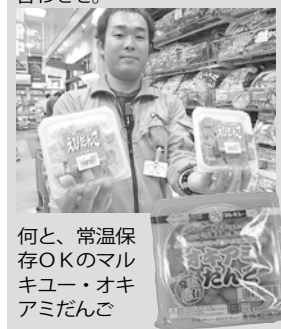
何と、常温保存OKのマルキュー・オキアミだんご

魚の食いは、エサで決まるほど、エサ選びは重要。基本は「生ミック」。ネリエも数種類は用意したい。マルキューのオキアミだんでは、なんと常温保存OK。これは便利だ。ほか冷凍の海エビや甘エビ。青物用にはキビナゴ、生きアジなどがあればOK。生きアジは釣り堀で販売されていることも多いので事前に問い合わせを。