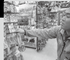
マダイ用、青物用など便利な仕かけは豊富

海上釣り堀の基本仕かけのうち、少し複雑なのがウキ釣りの仕かけ。ウキ、ウキ止め、シモリ玉、サルカンなどが必要だが、これにハリス、針までがセットになった仕かけも種類は豊富。釣行予定先などを伝えて、スタッフに相談するのが手取り早い。最近ではカモフラージュ使用のハリスなど、こだわりの商品も増えているので、最先端の仕かけを覚えておこう。