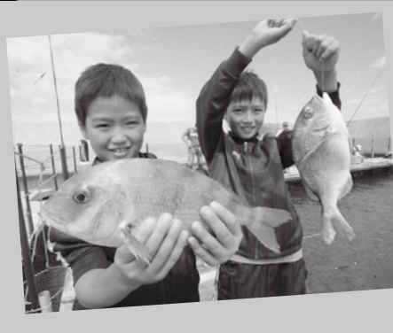
釣りが初めての女性だって、子供だって、教えてもらった通りに仕掛けを放り込めば大物が釣れちゃって、それが釣り堀の魅力だ