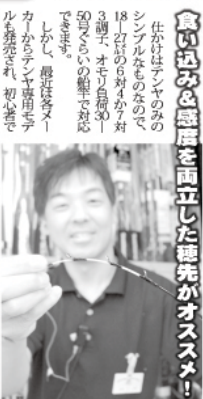
食い込み+感度を両立した穂先がオススメ!

仕掛けはテナヤのみのシンプルなものなので、18〜27斤の6対4か7対3調子、オモリ負荷30〜50号くらいの船竿で対応できます。 「まず一本」として、最近各メーカーからテナヤ専用モデルも発売され、初心者でも扱いやすくなっています。ういったモデルをセレクトしましょう！ また、日や時間帯によつては、「アタリはあるけどなかなか乗らない」ことが多いのも事実。こ