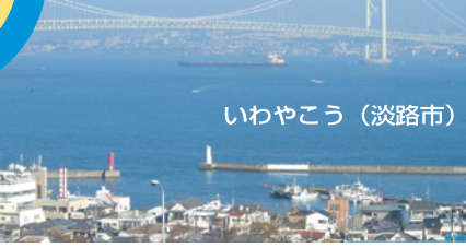
■主なターゲットのベストシーズン (月)