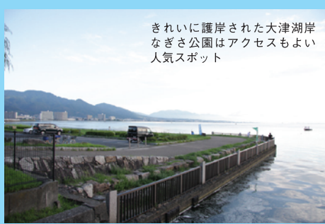
きれいに護岸された大津湖岸 なぎさ公園はアクセスもよい 人気スポット