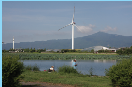
風車があるの鳥丸半島との間はヨシ群落保護地区に指定されており動力船での侵入は許可が必要