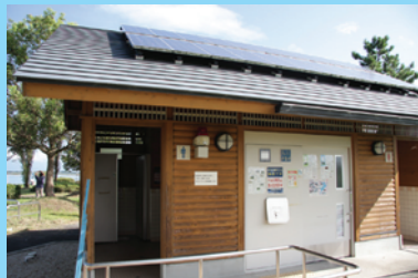
ソーラー発電を利用し水を循環させるエコリサイクルトイレ。土を使って水をきれいにし再利用している