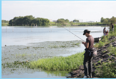
石組み護岸で足場は悪くない。水深がないので遠投できるタックルとルアーで広範囲をねらいたい