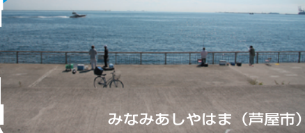
みなみあしやはま (芦屋市)

■ヨットハーバー（ベルポート芦屋）と潮芦屋ビーチ以外の、周囲どこからでも竿を出せる大きな埋立地で、北岸の水道部、西岸が石畳、南岸と東岸の一部が手すり付きベランダで、足場もよく安全。駐車場、トイレも多いのでファミリーフィッシングに最適の場所。釣りものも豊富で、ポイントさえ間違わなければサビキ釣りから探り、ブツ込み、エビ撒き釣り、落とし込み釣り、ルアーとあらゆるジャンル釣りが楽しめる。浅い石畳では竿下のサビキ釣りが難しい。