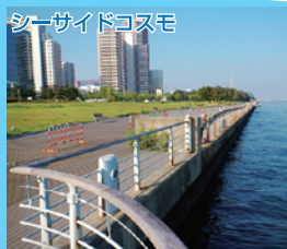
シーサイドコスモ

真横に有料駐車場がありアクセスが非常に楽な釣り場。手すりはない。チヌ、ハネはもちろんタチウオやタコ釣りでも人気がある