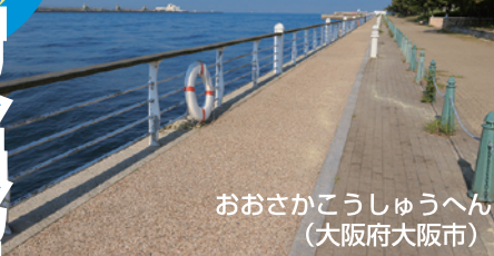
おおさかこうしゅうへん (大阪府大阪市)

■大阪港には一般に立ち入りが開放され釣りができる護岸が数ヶ所ある。特にシーサイドコスモ、舞洲シーサイドプロムナード、鶴浜緑地などが手すり付きで安全。シーサイドプロムナードにはトイレもあるので安心。アジやイワシねらいのサビキ釣りからチヌやハネなどマニアックなウキ釣り、ナイトゲームではアジングなども可能。引き釣りやワインドでのタチウオ狙い、夏はタコ釣りも面白い。新淀川左岸はルアーでシーバスやチヌ、秋口はハゼ釣りなどが楽しめる。