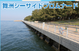
舞洲シーサイドプロムナード

手すりなどの設備はないが足場はフラット。常吉大橋の真下は雨や直射日光を避けるのに最適