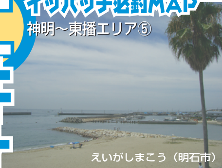
えいがしまこう (明石市)

■サーフが続く林崎から東二見までの単調な海岸線のなかで、播磨灘に突き出すように造られたのが江井ヶ島港だ。水深があり潮通しもよいため、多くの魚種が集まり好釣り場になっている。古くからカレイやキスなどの投げ釣りでは知られていたし、周辺のサーフにある小突堤も投げ釣りが面白い。このエリアではタチウオが狙える数少ないフィールドだ。港入口付近には有料駐車場、トイレもあるので家族連れでサビキ釣り、チョイ投げなどを楽しむのもいだろう。