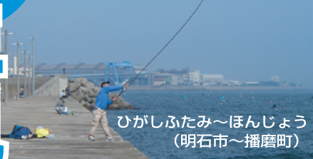
ひがしふたみ～ほんじょう (明石市～播磨町)

■明石市の西端に位置する東二見と播磨町の本荘にまたがって広大な2つの人工島があるが立入禁止、釣り禁止区間も多いのでルールを守ってほしい。本命の沖向き海岸線のほとんどにテトラが入っており足場が悪い。そんななか比較的安心して釣りができるのは本荘人工島の西端に延びる赤灯波止。潮通しがよくさまざまな魚が狙えるが波に弱いので荒れてきたら早めの撤収を心がけてほしい。以前、好ポイントだった東二見人工島の北東にある波止、古宮漁港は立入禁止。