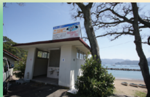
阿納海水浴場入口付近にあるトイレ。すぐ横は有料駐車場になっていて浜へのアクセスに便利