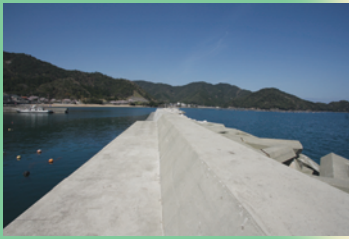
犬熊の波止は外向きテトラからアオリイカがねらえる。フカセ釣りでチヌ、グレをねらう人も多いポイント

■小浜市の東、矢代湾奥に位置するのが阿納港と犬熊港。海岸線が東向きのため季節風が厳しい冬も背後の山が遮ってくれるため波静か。阿納は北から南へ伸びる波止がメインの釣り場。手すりがあり安全でトイレ、水道もあるのでファミリーフィッシングにも最適。小アジねらいのサビキがおすすめ。港内にある海上釣り堀を利用してよい。犬熊は波止外向きのテトラからエギングが面白いが足元に注意。阿納と犬熊の間にある2つの海水浴場からは投げ釣りのキスに期待。